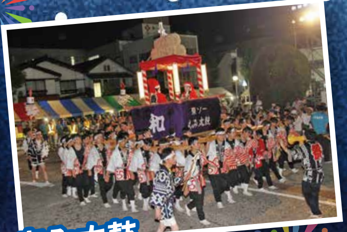
もみ太鼓 (東ソー(株)南陽事業所)