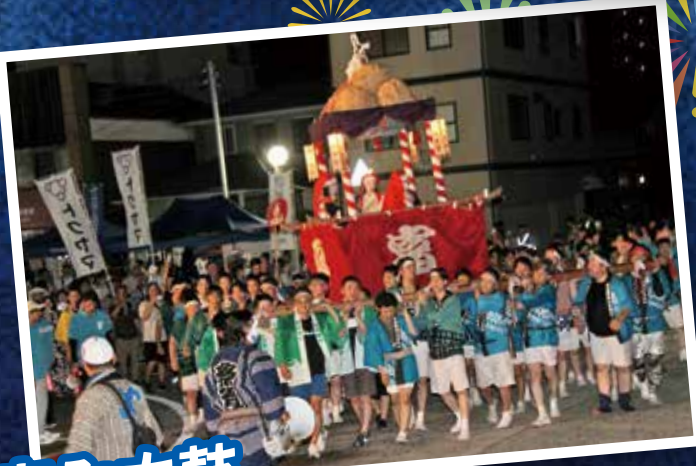
もみ太鼓 (サンフェスタしんなんよう実行委員会)