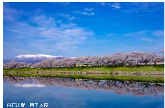
白石川堤一目千本桜

気象予報士、税理士。埼玉県三郷市生まれ。早稲田大学大学院理工学研究科修了。大学院在学中に気象予報士に登録。日本テレビ「スッキリ」に気象キャスターとして出演しながら税理士試験に合格し、2016年に開業。21年に越谷税務署長表彰受賞。趣味の鉄道では、鉄道イベント出演や時刻表、鉄道模型雑誌にコラムを寄稿。プログラミングやダムにも造詣が深く、「複業」として得意を組み合わせる幅広く活躍中。地元の「三郷市PR大使」を務めるなど、地域との関わりも深めている。