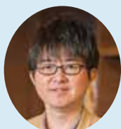
■コラム/ 藤富 郷 ふじとみ・ごう

ある河川国道事務所の調査によると、老朽化した木が伐採された際、根の周辺の土が非常に軟らかくなっており、根も腐って空洞になっていくことが分かりました。これでは、川の水位が上昇した場合、堤防が崩れ、水が漏れて被害が発生する可能性があります。桜堤を残すためには、枯れた木を植え替える必要がありますが、防災の観点から今はできなくなっています。1997年の河川法改正により、堤防に新たに木が植えられなくなりましした。堤防の一番の目的は、水害から命と生活を守ることであり、治水に影響が出ない必要があるからです。今後、桜の木が枯れ続ける と桜堤がなくなってしまうことになりませんが、観光の目玉や、地域の誇りでもある桜並木は、なんとか残したいと皆が願っています。この桜堤を残していくためには、まずは桜を丁寧に手入れし、長生きさせることが大切です。もう一つは、堤防の幅を広げ、新しく広がった部分に桜の木を植えることです。治水に影響の出ない部分に植えることは問題がなく、今の桜が枯れても、次世代の桜堤を残すことができます。 早咲きで有名な静岡の河津川沿いの河津桜堤では、まさにこの取り組みがされています。堤防を広げて新しい桜を植え、観光資源を残す計画が、行政と地域が一体となって進められており、10年、20年、30年先を見据えたプランになっています。 防災を考慮しながらも、日本一の春の景色を守る取り組みを諦めず、これからも桜堤を末永く残していきたいですね。