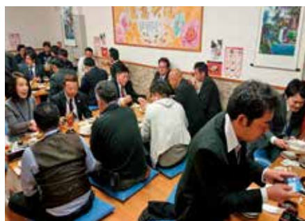
▲ 同世代同士で盛り上がる連絡協議会懇談会