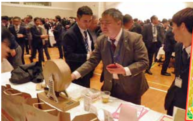
▲キャッシュレス決済限定ガラポン抽選会では 景品に新年互礼会オリジナル福袋が用意された