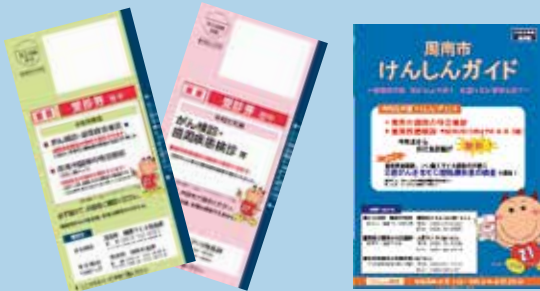
令和元年度受診券

市では毎年6月から2月末までがん検診を実施しています。 対象年齢の市民はどなたでも受けられます。 ※市のがん検診の受診をご希望の方は下記までお問合せください。