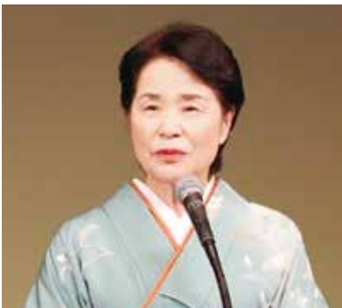
▲藤井律子 周南市長