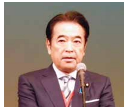
▲北村経夫 参議院議員