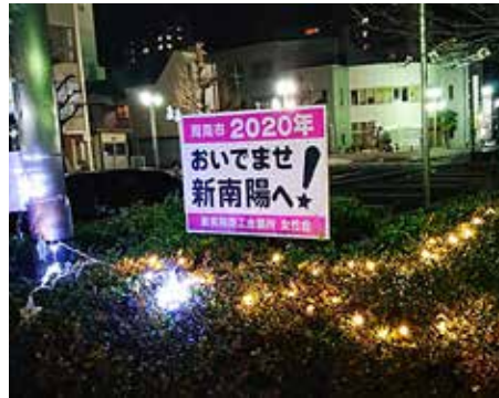
▲イルミネーションの様子