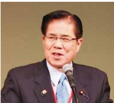
▲榎屋敬悟 衆議院議員