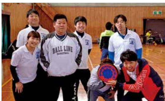
▲ 参加メンバーで集合写真

今年度の種目はドッチビーで、当単会からは8名が参加した。初めてドッチビーをプレーする会員も多く、新南陽YEGチームは苦戦をしいられることも多かったが、積極的にプレーして一丸となって試合に臨んだ。試合を通じて単会内や他の商工会議所青年部会員と交流を深めることができた大会となった。