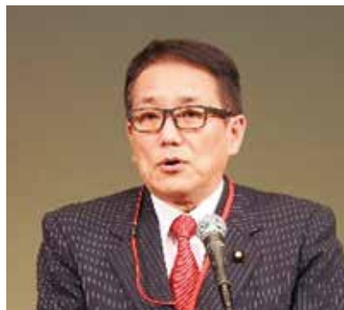
▲江島 潔 参議院議員