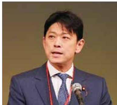
▲高村正大 衆議院議員