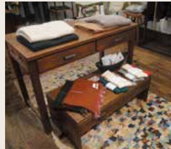
お友達や大事な人へのプレゼントに♡