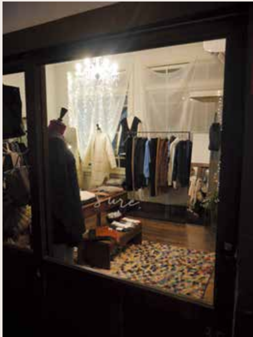
レトロな空間から落ち着きのある店内を何うと、 穏やかな色彩が日常を彩ってくれます。