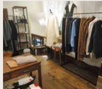
寒い冬の日もトータルでコーディネート おしゃれな暖かい一日を!!