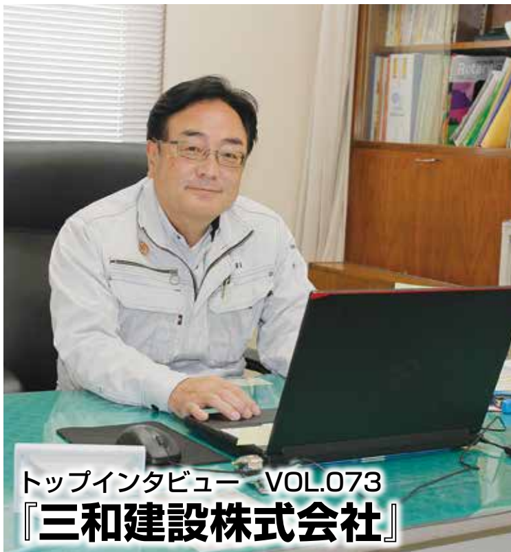
トップインタビュー VOL.073 『三和建設株式会社』