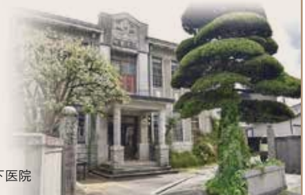
昭和初期を感じさせる旧日下医院

〒746-0011 山口県周南市土井二丁目4-9 旧日下医院内 Tel:0834-62-8001 営業時間 平日 10:00~16:00 土日祝 10:00~17:00 定休日 火曜日、第3水曜日+不定休