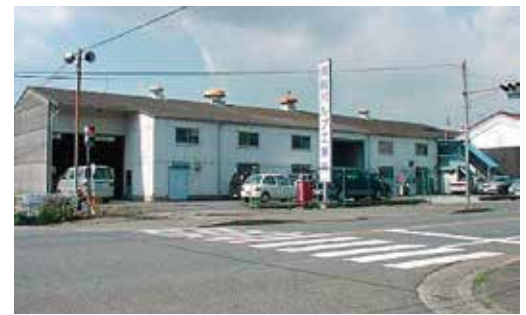
▲水島営業所（岡山県倉敷市）