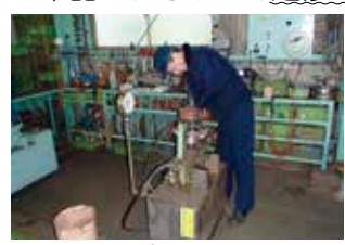
▲バルブテストの様子

安全弁試験、自動調節弁試験、自動調節弁調整、ゲート弁テスト、 電動アクチュエーター調整、手動弁試験等行い安全弁が完成品します。 単品は、もちろん定修工事等、数百台単位のオーダーも承ります。