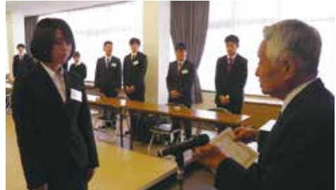
▲兼安副会頭より受講生へ修了証書が授与された