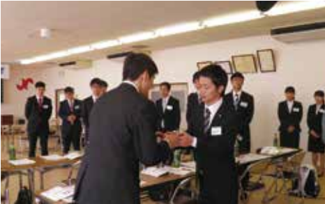
▲名刺交換の仕方を学んだ