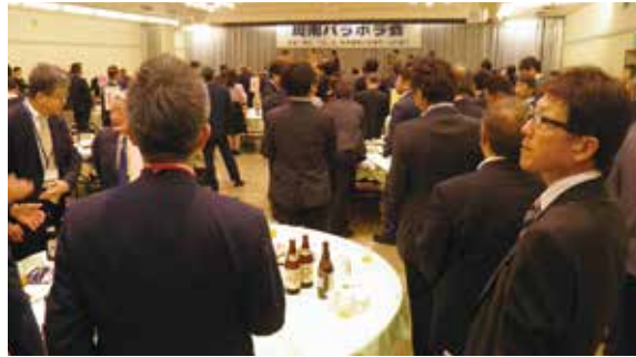
▲新たな情報交換の場として活用を

異業種・異分野の参加者によるビジネスマッチングを目的に、産・官・学より多数参加した。今回も各団体より趣向を凝らしたイベント告知等が行われ大いに盛り上がった。会場は年度初めということで新しい顔ぶれも数多く参加され、名刺交換をする様子が随所に見受けられた。次回夏の周南パラボラ会は7月にピピ510で開催予定。