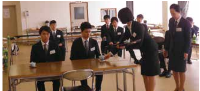
▲お茶出しを学んだ

今回の講習で学んだことはこれからの社会でのやり取りのためだけでなく、人としての成長そのものにも大きく関わる内容だと思っております。今回の経験をしっかりと活用し、より充実した生活にしたいと思っております。この度は本当にありがとうございました。