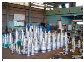
▲安全弁のテストの様子 熟練スタッフが丁寧にいきます

安全弁で非常に重要な技術、ラッピング（摺り合せ）は、熟練したスタッフが1台1台丁寧に摺り合せ調整を行っております。摺り合せは、ミクロン単位まで追求した超精密鏡面仕上げで行うので、 バルブの漏れでお困りの方は是非周南バルブ工業にお任せ下さい!!