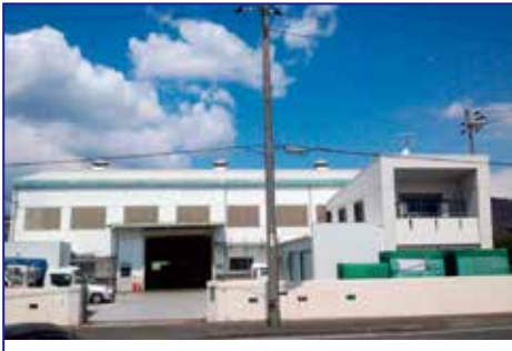
▲本体外観（周南市新田）

本社 周南市新田 2-7-11 ☎ (0834) 63-1268 水島営業所 岡山県倉敷市松江 2-2-10 ☎ (086) 456-5262 営業時間：8：00～17：00 休 日：土 日 祝日