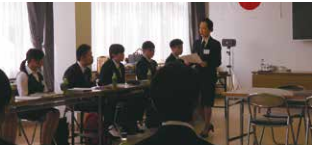
▲新入社員としての心構えを学んだ