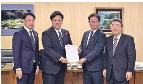
▲福田市議会議長と井本副議長へも要望書を提出した

本市幹部の方や市職員の方と商工会議所の役員・議員、部会役員、職員と活発な意見交換や情報交換、重要課題解決に向けた協議を行っているようご配慮をお願いします。