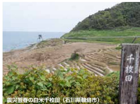
震災翌春の白米千枚田（石川県輪島市）

合同会社ヒナニモ代表。1986年筑波大学大学院理工学研究科修士課程修了。同年日本経済新聞社入社。IT分野、経営分野、コンシューマ分野の専門誌の編集を担当。その後、日経BP 総合研究所 上席研究員を経て、2025年4月から現職。全国の自治体・商工会議所などで地域活性化や名産品開発のコンサルティング、講演を実施。消費者起点をテーマにヒット商品育成を支援している。著書に『地方発ヒットを生む 逆算発想のものづくり』（日経BP社）。