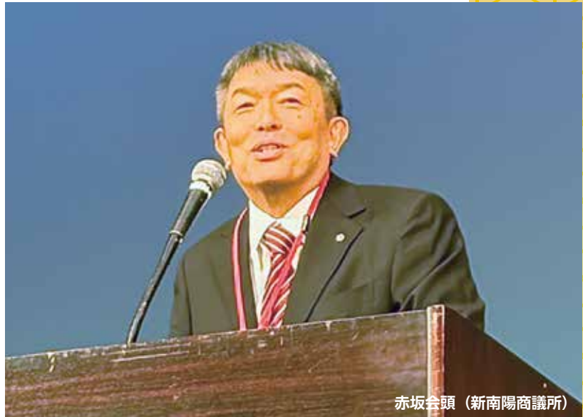
赤坂会頭（新南陽商議所）