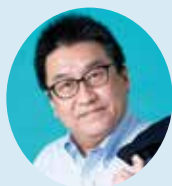
■コラム／渡辺 和博 わたなべ・かずひろ

られていないようでした。受け皿となるサービスも少なく、観光客目線での道案内や情報提供も乏しいと感じました。せっかくつくった施設の日常的価値の可能性を狭めているのが残念でした。地元優先の価値観は地域の結束を強める一方、顧客層や市場を広げる邪魔をする面もありそうです。