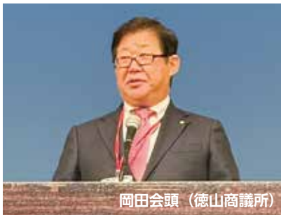
岡田会頭（徳山商議所）