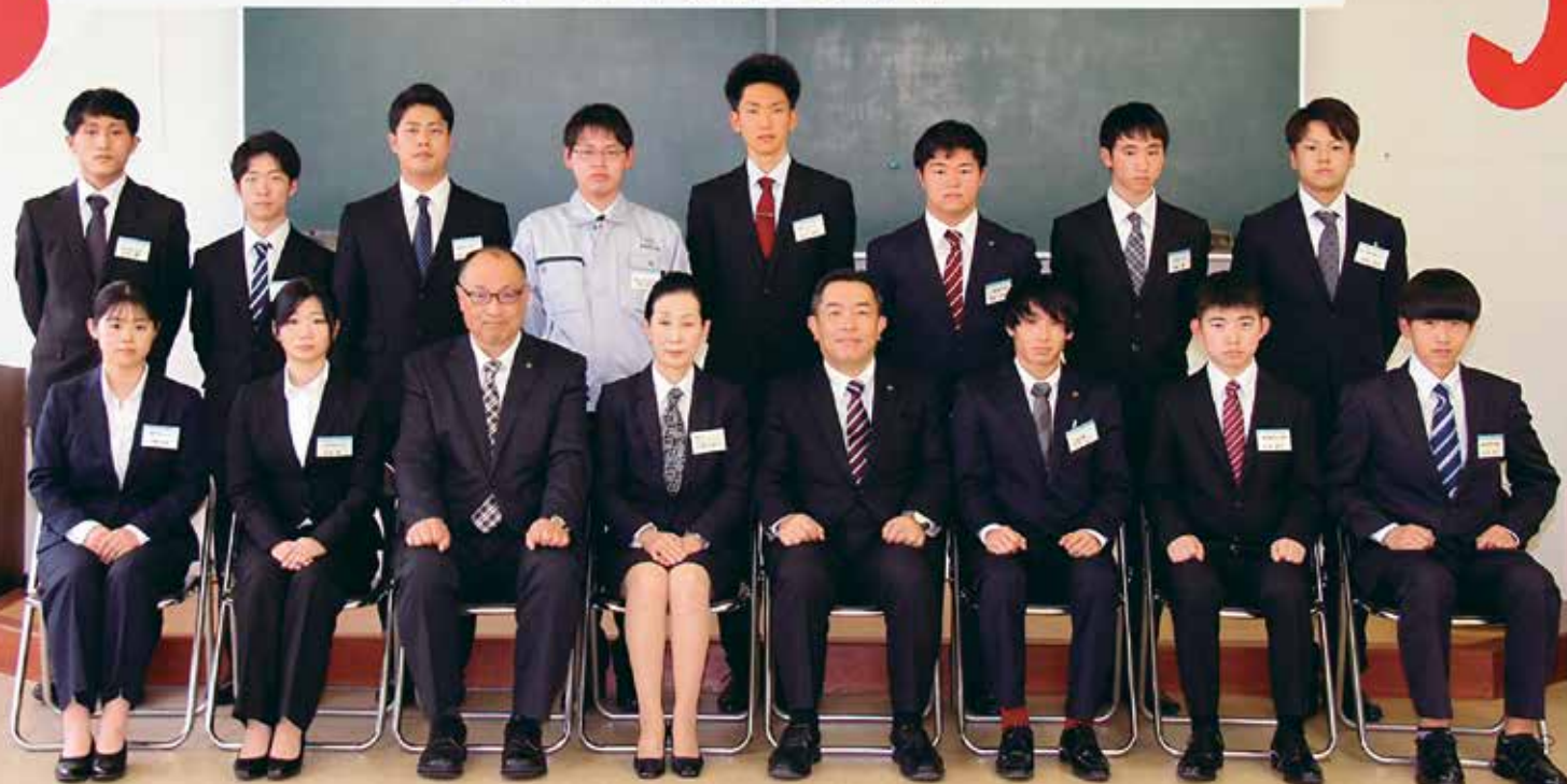
令和2年度 新南陽商工会議所 新入社員ビジネスマナー研修 令和2年4月3日