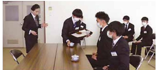
▲お茶出しを学んだ