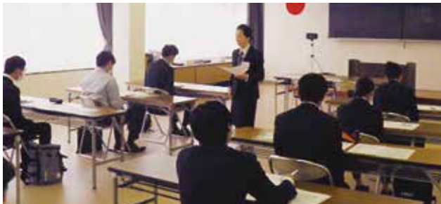
▲新入社員としての心構えを学んだ