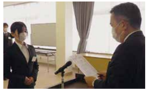
▲赤坂副会頭より修了証書が渡された