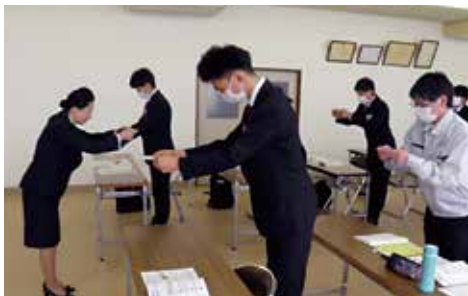
▲名刺交換の仕方を学んだ