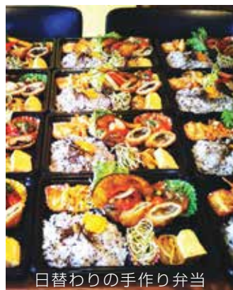
日替わりの手作り弁当

手作り弁当でも有名な飲食店喫茶さくらんぼ。周南市の老舗ホテル跡地に新しくオープンしたスーパードッグの裏路地にひっそり佇む。 喫茶さくらんぼは新南陽地区で5年前にオープン。2年前に現在の徳山地区に移転し、人気の手作り弁当をはじめランチとディナーの店舗営業に力を入れている。 一軒家を改装した隠れ家的な雰囲気、年配の方にも人気のテーブル席と家族連れでもゆっくりできる座敷部屋がある。