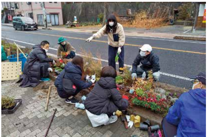
多大なるご芳志を賜りました株式会社三菱UFJ銀行様に厚く御礼申し上げます