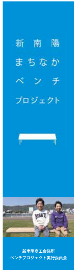
新南陽商工会議所 ベンチプロジェクト実行委員会

デザイナー、建築士のグループ、ナシブドウグミ様にベンチのデザインを依頼し、ベンチのステンレス部分は徳山興産(株)様で加工、木の部分は(株)みうら様で加工していただきました。蛇籠の設置、ベンチの据付は長崎建設(株)様にお願いし、同時期にゆめ風車通りに植栽を担当してくださった(有)サイトウガーデンプラン様、植栽には(株)三菱UFJ銀行様をはじめ、多くのボランティアの方々の参加がありました。