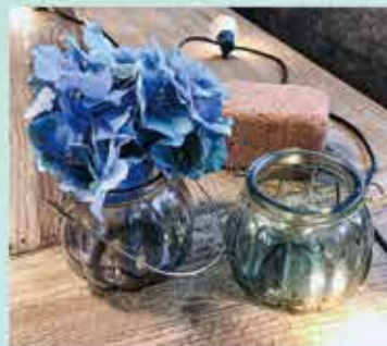
花瓶や鉢などの花材や、季節に合わせた雑貨の販売。