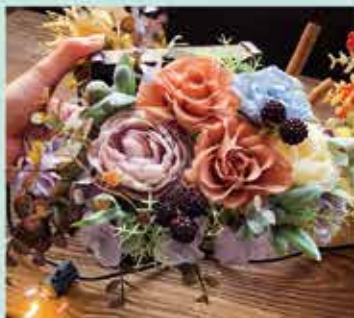
プリザーブドフラワー・ドライフラワー・アーティフィシャルフラワーの販売。