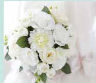
生花・プリザーブドを使用し、ご要望に合わせて作成致します。