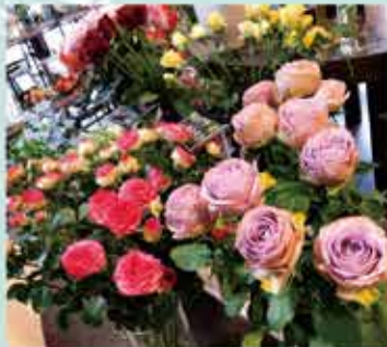
様々なシーンに合わせた生花を数多くご用意しております。