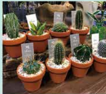
品種・サイズともに様々な観葉植物、多肉植物などを販売。