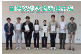
国際交流活動支援事業