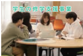
学生の修学支援事業

周南公立大学基金は学生の修学を積極的に支援するとともに、地域を活性化することを目的に創設しました。