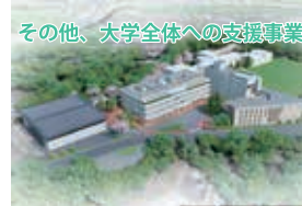
その他、大学全体への支援事業