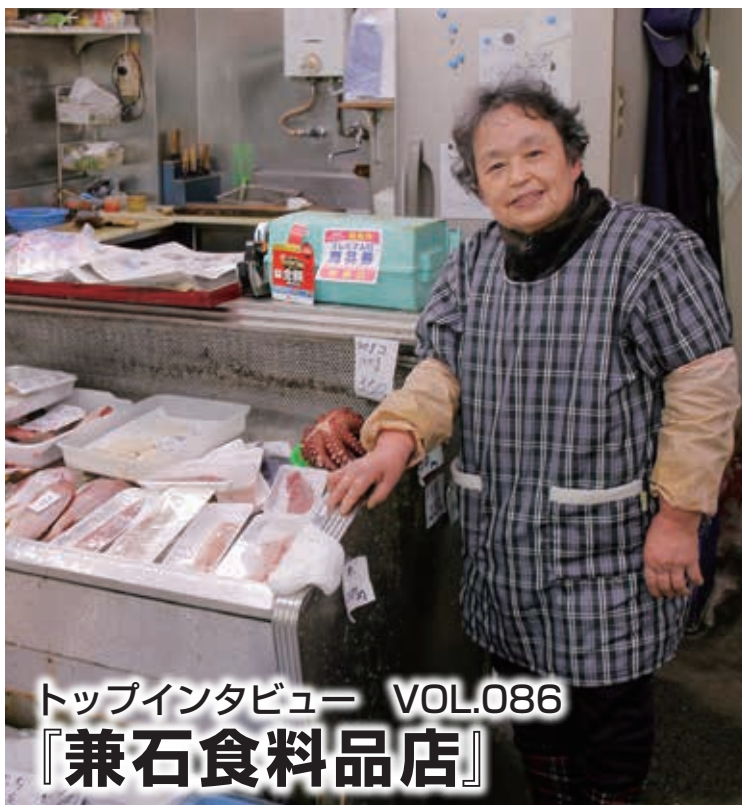
トップインタビュー VOL.086 『兼石食料品店』