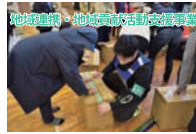
地域連携・地域貢献活動支援事業