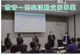
教育・研究活動支援事業